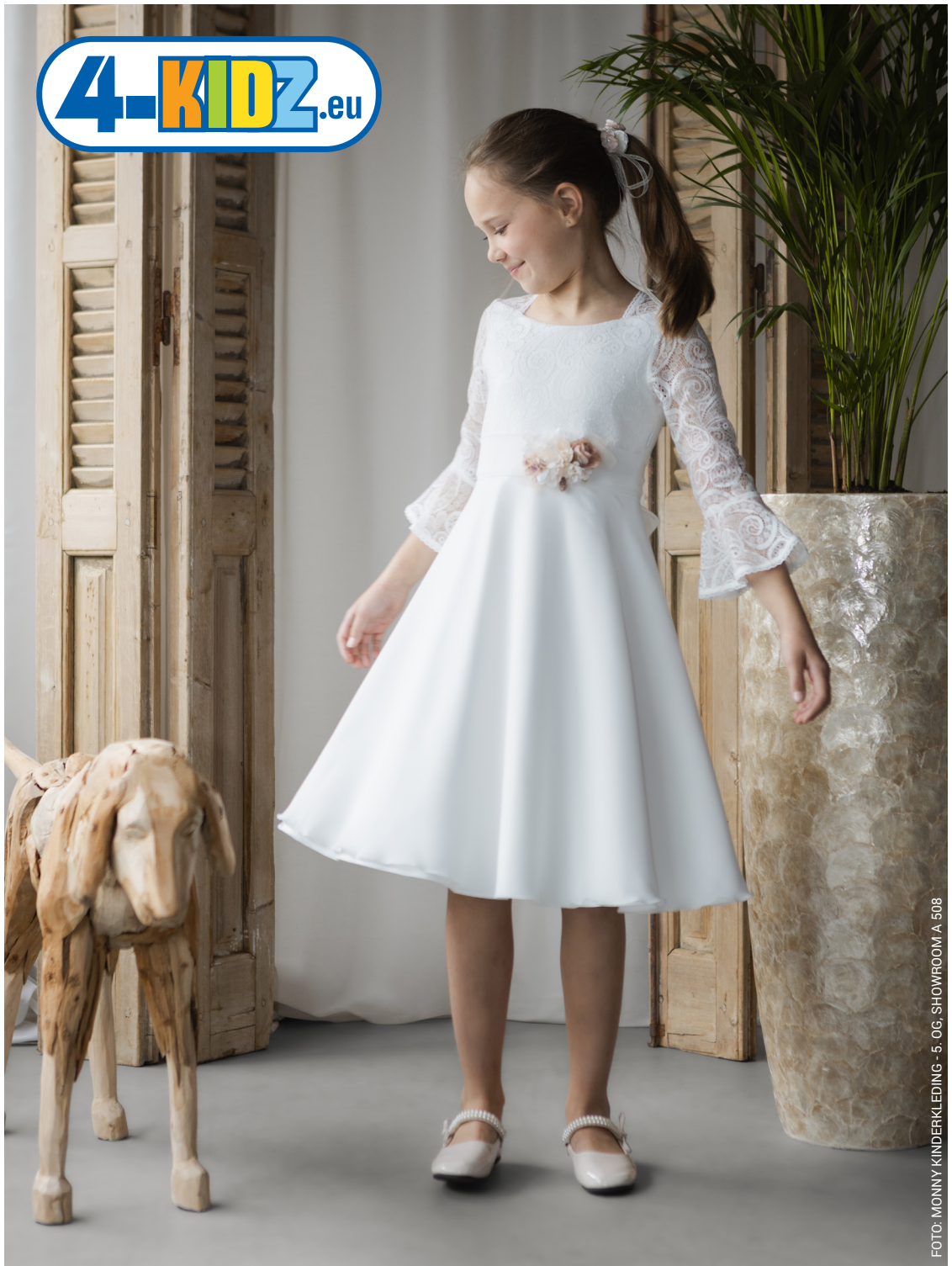
FOTO: MONNY KINDERKLEIDUNG - 5. OG, SHOWROOM A 508